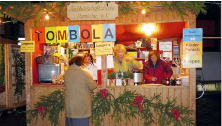
Gespendete Tombolapreise für Christkindlmarktstand