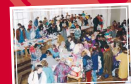
1994 Basar im Bürgersaal