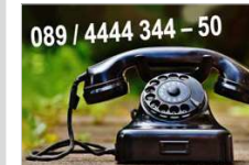
Dank neuer Telefonleitung immer erreichbar.

Das Sozialzentrum erhält eine neue Telefonnummer! Da die bisherigen Nebenstellen ausgelastet sind und zudem eine leistungsstärkere Internetverbindung erforderlich ist, ist dieser Schritt unvermeidlich. Dank sorgfältiger Planung erfolgt die Umstellung reibungslos und ohne Unterbrechungen.