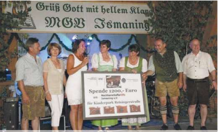
Katholische Frauen und Männergesangsverein