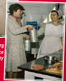
1978 Menüservice J. Frey