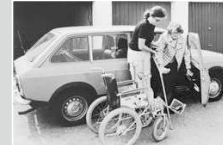
K. Ley begleitet regelmäßig Senioren zu Arztterminen.

Der wachsende Helferkreis ermöglicht es, die Seniorenbegleitungen weiter auszubauen. Der Menüservice wird auf Tiefkühlgerichte von Apetito umgestellt, die nun wöchentlich ausgeliefert werden. Die Menüs werden in Gefriertruhen im Kutscherbau gelagert.