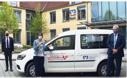
VR Bank sponsert Caddy mit Rollstuhlrampe