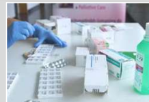
Der Pflegedienst freut sich über das neue Platzangebot im 2. OG.

Im Jahr 2021 ziehen die Mitarbeiter des Pflegedienstes, der Buchhaltung und der Abrechnung ins 2. OG des Sozialzentrums um. Der Umzug verbessert die Arbeitsbedingungen erheblich. Nun können auch Ratsuchende in diskreter und angenehmer Atmosphäre beraten und versorgt werden.