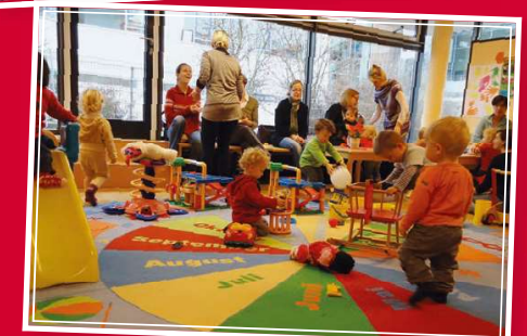
2011 Offenes Cafe

"Was wir heute tun, entscheidet, wie die Welt morgen aussieht."