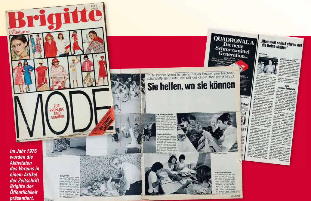
Im Jahr 1976 wurden die Aktivitäten des Vereins in einem Artikel der Zeitschrift Brigitte der Öffentlichkeit präsentiert.