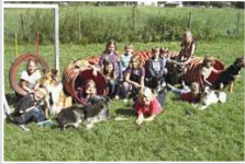
Schulkinder aktiv im Ferienprogramm beim Hundesport.

Erstmals findet das Ferienprogramm für Grundschul Kinder in den Oster- und Sommerferien statt, mit spannenden Aktivitäten. Gleichzeitig werden die Öffnungszeiten der Seniorentagespflege erweitert: Senioren werden nun an jedem Werktag, statt nur an drei Tagen, betreut und versorgt.