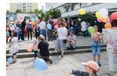
Kunterbunte Feier zum 20. Geburtstag des Familienzentrums.