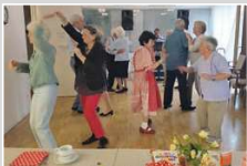
Tanzfreudige Senioren besuchen den Tanztée in der Tagespflege.

In der Seniorentagespflege findet erstmals das Café Zeitlos statt. Menschen mit nachlassendem Gedächtnis genießen hier gemeinsame Zeit und trainieren ihre kognitiven Fähigkeiten. Gleichzeitig startet für die nächsten vier Jahre ein Tanztée für Senioren mit und ohne Demenz.