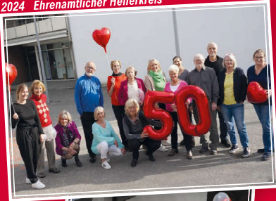
2024 Ehrenamtlicher Helferkreis