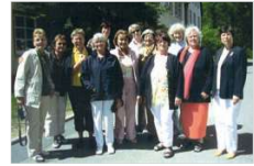
Erste Helfer beenden erfolgreich die Ausbildung zu Hospizbegleitern.

Im Untergeschoss des Sozialzentrums eröffnet ein Second-Hand-Laden für Kinderkleidung. Erste Seniorenhelfer werden nach standardisierter Ausbildung qualifiziert. Gleichzeitig entsteht ein Hospizkreis, der sich 2008 von der Nachbarschaftshilfe abspaltet und heute am Bahnhofplatz ansässig ist.