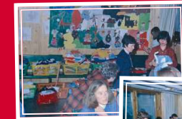
1978 Basar kath. Jugendheim