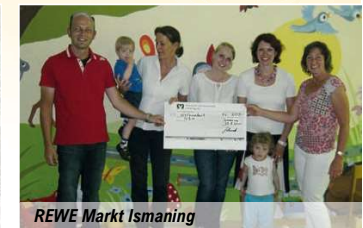
REWE Markt Ismaning