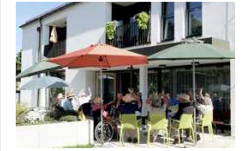
Gesellige Runde der Tagesgäste im Garten der neuen Einrichtung.

Umzug der Seniorentagespflege in die neue Seniorenwohnanlage in der Aschheimer Straße 6. Dort erwarten die Mitarbeiter optimale Arbeitsbedingungen und die Gäste eine Wohlfühlatmosphäre auf höchstem Niveau. Die Einrichtung erfüllt modernste Standards und bietet Platz für bis zu 20 Gäste.