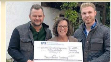
Ensemble des Bauerntheaters