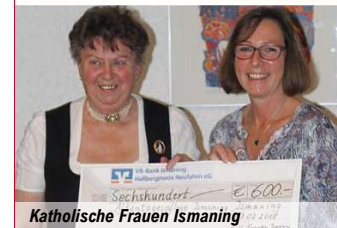
Katholische Frauen Ismaning