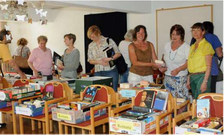
Buchspenden von Ismaninger Leseratten