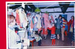
1978 Basar evang. Gemeindehaus