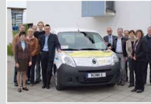
Feierliche Übergabe des ersten werbefinanzierten Fahrzeugs.

Geschäftsleute aus Ismaning und Umgebung finanzieren mit ihren Werbeanzeigen ein neues Sozialmobil für den ambulanten Pflegedienst. Die Versorgung der Pflegebedürftigen in der Gemeinde konnte hierdurch weiter ausgebaut werden. Drei weitere Werbefahrzeuge sollten in den nächsten Jahren folgen.