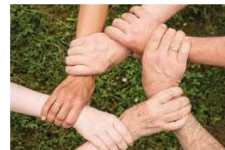
Hand in Hand schaffen wir es durch die Corona-Pandemie.

Die Corona-Pandemie trifft alle schwer. Durch die Schutzmaßnahmen fühlen sich viele Menschen einsam. Die NBH reagiert mit dem Seniorenpatenschaftsprojekt "Silberstreifen – Gemeinsam gegen Einsamkeit". Ebenso organisiert sie gemeinsam mit den beiden Kirchen Vorratseinkäufe für Betroffene.