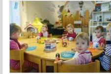
Gemeinsames Frühstück in der neuen Größtagespflege.

Mit Unterstützung der Gemeinde eröffnet die erste Kindergrößtagespflege in der Unterförhringer Straße. In der Einrichtung betreuen zwei Tagespflegepersonen maximal zehn Kleinkinder bis zum Eintritt in den Kindergarten. Das Betreuungsmodell ist für berufstätige Eltern eine beliebte Alternative zu den Krippen.