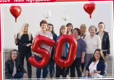
2024 Team Tagesmütter