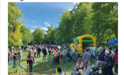
Zahlreiche Bürger genossen das große Jubiläumsfest im Hain.

Die Nachbarschaftshilfe feiert ihr 50-jähriges Jubiläum mit einem großen Familienfest im Hain, das Anfang Mai viele Ismaninger anzieht. Alt und Jung genießen ein abwechslungsreiches Programm bis in die Abendstunden. Gleichzeitig eröffnet der Stützpunkt für die Kindertages-Ersatzbetreuung im Sozialzentrum.