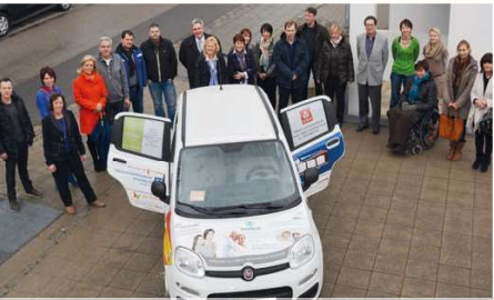
Werbemobil Dank Ismaninger Geschäftsleuten