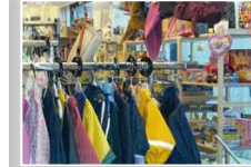
Second-Hand-Laden im Untergeschoß des Sozialzentrums.

Der beliebte Second-Hand-Laden, der bisher in einem kleinen Kellerraum untergebracht war, platzt aus allen Nähten. Durch den Auszug des BRK aus dem Untergeschoss des Sozialzentrums kann er nun in größere, hellere Räume umziehen, was das Angebot deutlich verbessert.