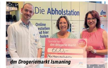
dm Drogeriemarkt Ismaning