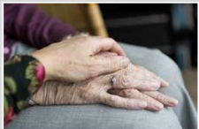
Experten beraten bei Herausforderungen im Pflegealltag.

Ein Gesprächskreis für pflegende Angehörige bietet Betroffenen ab sofort einmal im Monat die Gelegenheit, sich auszutauschen und Unterstützung zu erhalten. Dafür konnten drei externe Fachkräfte aus der Altenpflege gewonnen werden, die den Angehörigen regelmäßig bei Fragen zur Seite stehen.